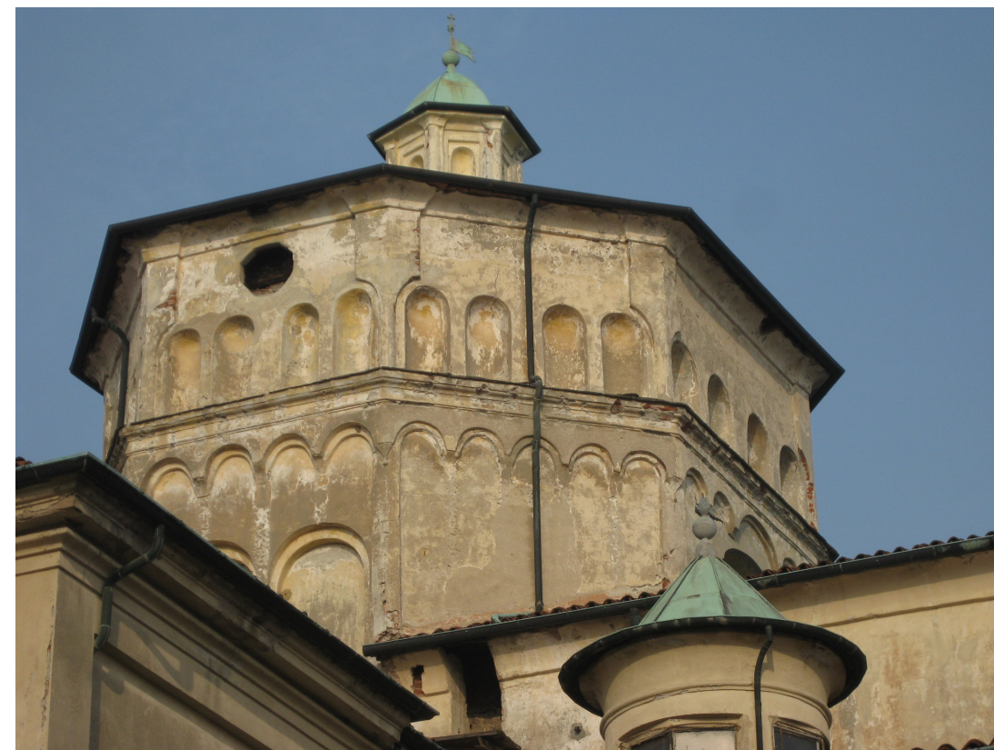
3. Veduta ravvicinata del prospetto sud ed est del tiburio prima dell'intervento.

tutta probabilità elementi di suspensurae romane riutilizzati. L'illuminazione all'interno era garantita da tre finestre, una bifora a sud e due monofore a ovest ed est, realizzate con elementi laterizi che dalle dimensioni risultano essere di epoca romana, riutilizzati e ritagliati, e con superfici lavorate a sgraffature parallele in obliquo o a spina pesce, a mattoni già in opera, tecnica già evidenziata dall'ampliamento romanico della cripta e nei pilastri