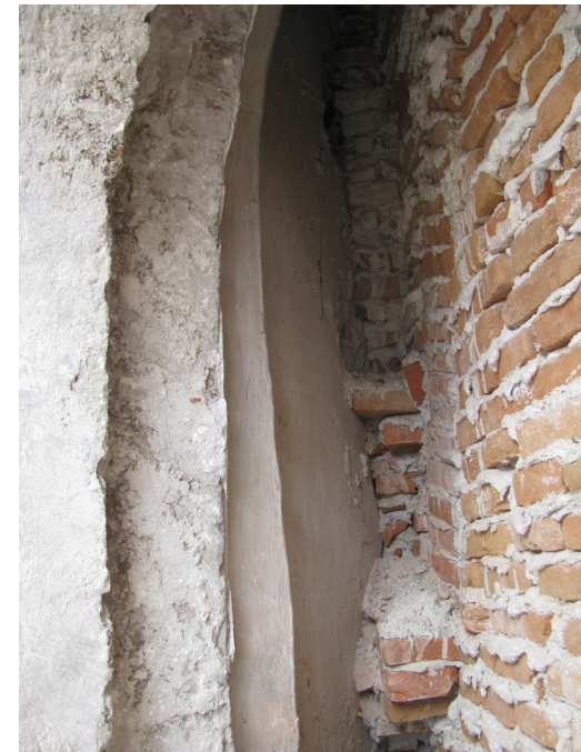
5. Smantellamento del muro settecentesco di tamponamento della bifora sud

riconoscimento di pigmenti e dei medium leganti mediante cromatografia su strato sottile e FTIR, e la termoluminescenza, fondamentale per datare il laterizi impiegati nella costruzione.